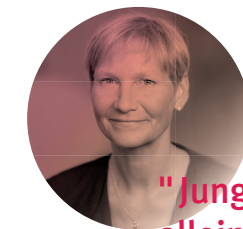
KIRSTEN FEHRS Bischofin im Sprengel Hamburg und Lübeck der Nordkirche

Zugleich wurde das Recht junger Menschen auf Partizipation stark beschnitten. Statt ihre Bedürfnisse ernst zu nehmen, wurden junge Menschen nur als Schüler*innen gesehen oder als verantwortungslose Party-Generation gebrandmarkt. Um jungen Menschen eine positive Perspektive zu bieten, brauchte es Corona-konforme Sommer-Angebote und eine Stimme für sie. Es war nötig klarzustellen: Junge Menschen sind #zukunftsrelevant.